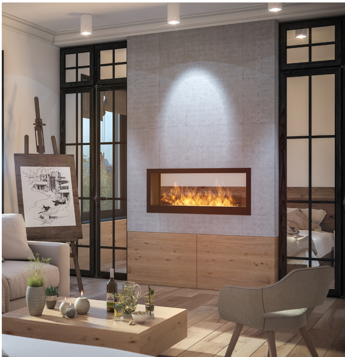
Biokominek 2 Side 1200